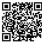
Video Conoce más acerca de la fundación.

género un acceso fácil y rápido a servicios de asesoramiento legal y acompañamiento psicológico. Queremos ofrecer un entorno seguro donde puedan compartir sus experiencias, recibir orientación legal confiable y apoyo emocional. Buscamos concientizar a la sociedad sobre la violencia de género y abogar por cambios significativos en las políticas y actitudes que promuevan la igualdad y la seguridad de las mujeres.